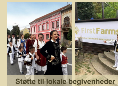
Støtte til lokale begivenheder